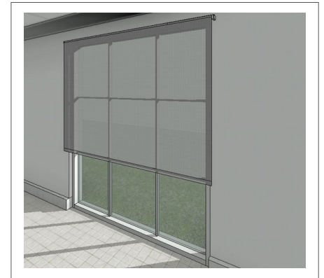
Objeto BIM Multinivel